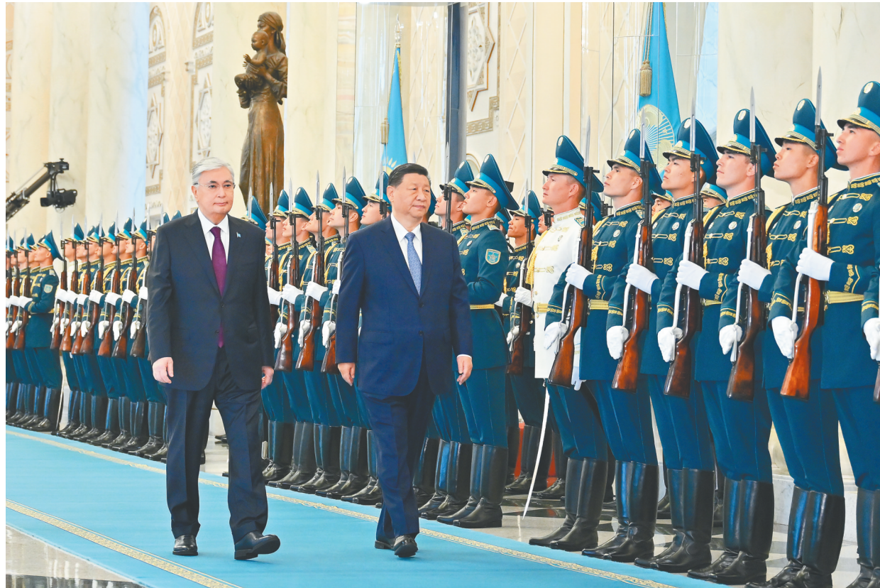
当地时间7月3日上午,国家主席习近平在阿斯塔纳总统府同哈萨克斯坦总统托卡耶夫举行会谈。托卡耶夫为习近平举行隆重欢迎仪式。这是习近平在托卡耶夫陪同下检阅仪仗队。