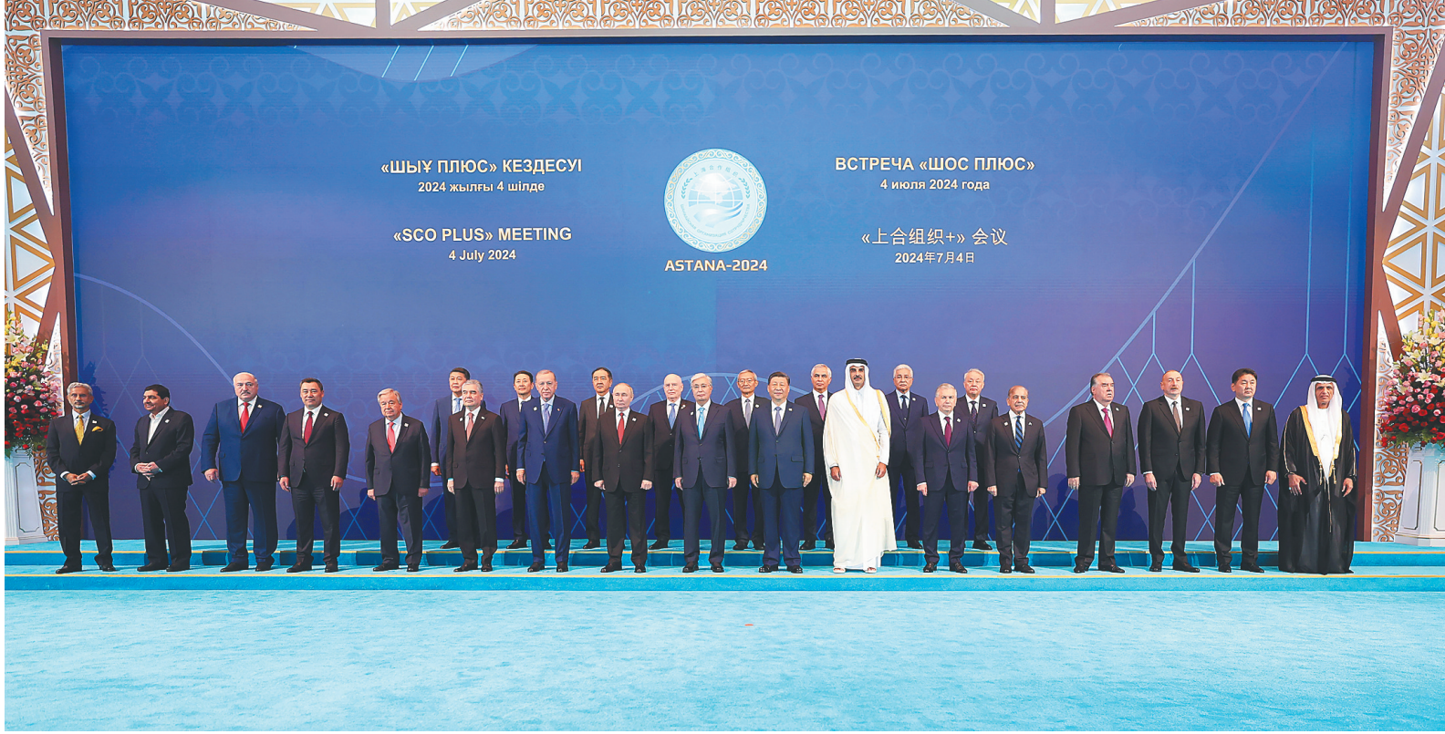
当地时间7月4日下午，国家主席习近平在阿斯塔纳出席“上海合作组织+”阿斯塔纳峰会并发表题为《携手构建更加美好的上海合作组织家园》的重要讲话。峰会开始前，习近平出席托卡耶夫为与会代表团团长举行的欢迎宴会并集体合影。

新华社阿斯塔纳7月4日电(记者孙浩 黄河 张继业)当地时间7月4日下午，国家主席习近平在阿斯塔纳出席“上海合作组织+”阿斯塔纳峰会并发表题为《携手构建更加美好的上海合作组织家园》的重要讲话。习近平指出，我们首次以“上海合作组织+”的形式举行峰会，好朋友、新伙伴济济一堂、共商大计，说明在新的时代条件下本组织理念广受欢迎，成员国的朋友遍布天下。当前，世界之变、时代之变、历史之变正以前所未有的方式展开。人类文明在大步前进的同时，不安全、不稳定、不确定因素也明显增加。应对好这一变局，关键要有识变之智、应变之方、求变之勇。我们要牢固树立命运共同体意识，始终秉持“上