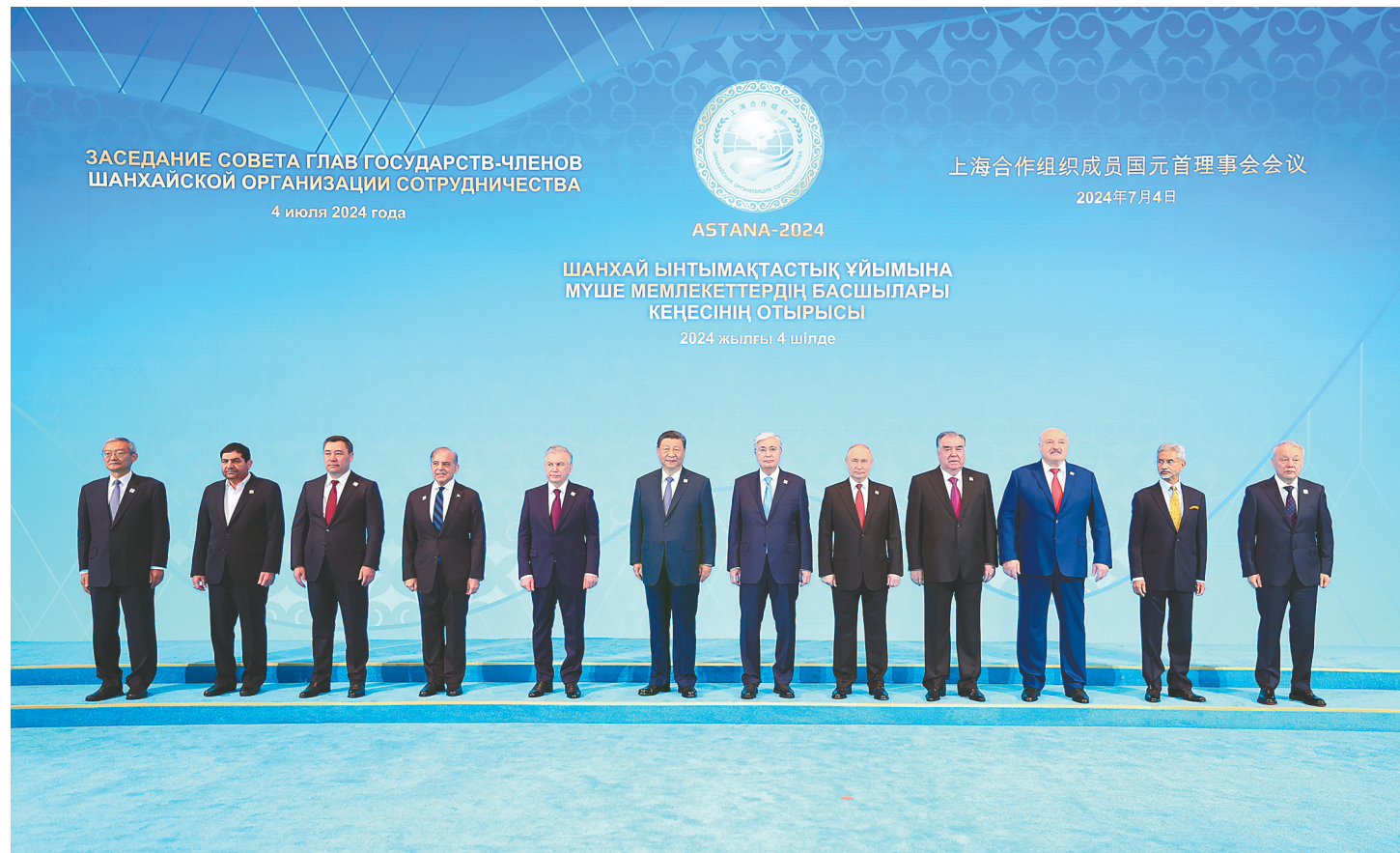
当地时间7月4日上午，国家主席习近平在阿斯塔纳独立宫出席上海合作组织成员国元首理事会第二十四次会议。这是习近平同上海合作组织成员国领导人集体合影。

新华社阿斯塔纳7月4日电(记者胡晓光 韩墨 杨依军)当地时间7月4日上午，国家主席习近平在阿斯塔纳独立宫出席上海合作组织成员国元首理事会第二十四次会议。上海合作组织轮值主席国哈萨克斯坦总统托卡耶夫主持会议，上海合作组织成员国白俄罗斯总统卢卡申科、吉尔吉斯斯坦总统扎帕罗夫、巴基斯坦总理夏巴兹、俄罗斯总统普京、塔吉克斯坦总统拉赫蒙、乌兹别克斯坦总统米尔济约耶夫、伊朗代理总统穆赫贝尔和印度代表以及上海合作组织秘书长等参加。习近平同上海合作组织成员国领导人集体合影，随后出席元首理事会会议。习近平在发言中高度评价哈萨克斯坦担任轮值主席国期