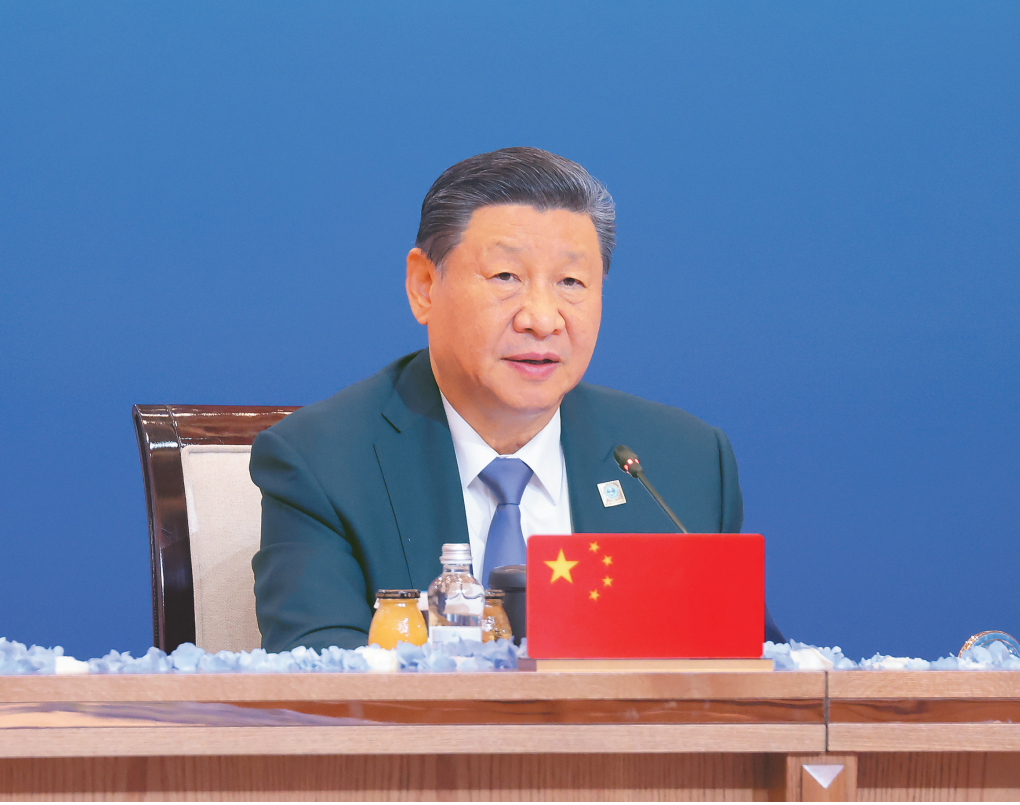
当地时间7月4日下午，国家主席习近平在阿斯塔纳出席“上海合作组织+”阿斯塔纳峰会并发表题为《携手构建更加美好的上海合作组织家园》的重要讲话。