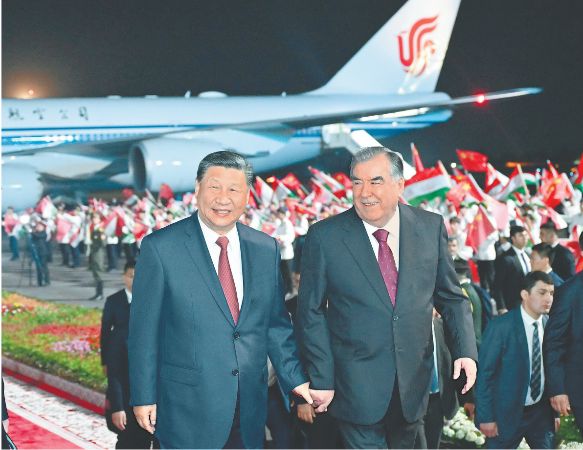
当地时间7月4日晚，国家主席习近平乘专机抵达杜尚别，应塔吉克斯坦共和国总统拉赫蒙邀请，对塔吉克斯坦进行国事访问。拉赫蒙在机场为习近平举行盛大隆重的迎宾仪式。

32年来，中塔关系持续快速健康发展，实现了从睦邻友好到战略伙伴关系，再到全面战略合作伙伴关系的飞跃，成为邻国间关系的典范。两国政治互信牢固，在涉及彼此核心利益问题上始终相互坚定支持。两国共建“一带一路”合作成果丰硕。我期待同拉赫蒙总统就新形势下中塔关系发展作出新规划、新部署，推动中塔全方位合作迈上更高水平。 蔡奇、王毅等陪同人员同机抵达。 下转 A03 版▶