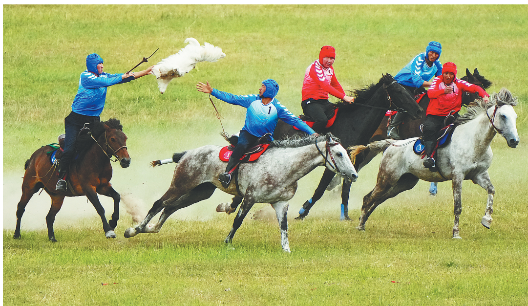
7月8日上午,第十二届全国少数民族传统体育运动会马上项目在伊犁哈萨克自治州昭苏县开赛。图为参赛选手在马上项目中展开角逐。

据悉,第十二届全国少数民族传统体育运动会将于11月在海南三亚举办。其中,马上项目于7月在新疆昭苏举办,分为竞赛项目和表演项目两大类,共有参赛选手229人,马匹276匹,骆驼16峰,运动队数量为历届运动会之最。