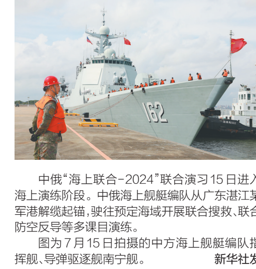
中俄“海上联合-2024”联合演习15日进入海上演练阶段。中俄海上舰艇编队从广东湛江某军港解缆起锚，驶往预定海域开展联合搜救、联合防空反导等多课目演练。