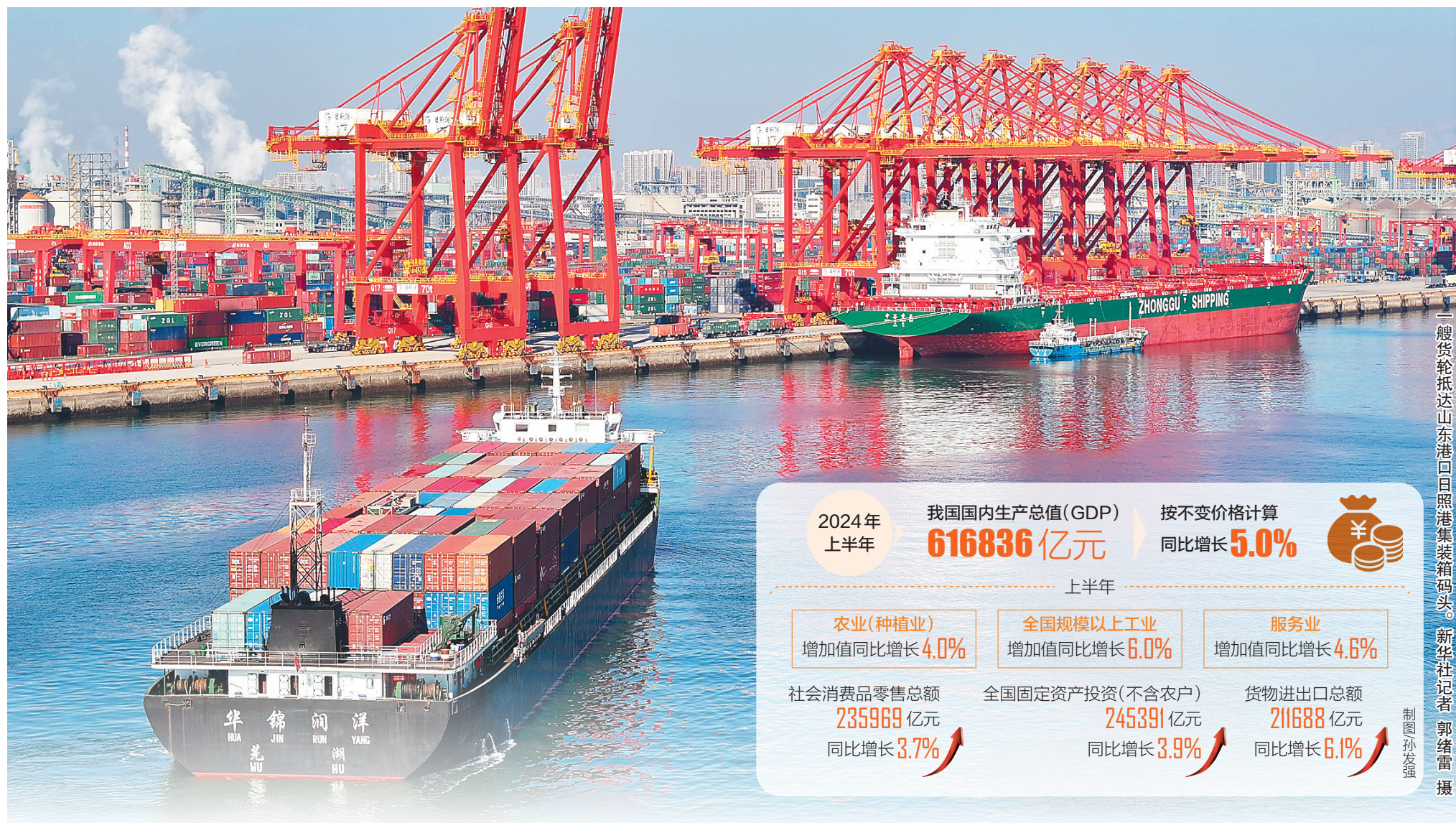
一艘货轮抵达山东港口日照港集装箱码头。