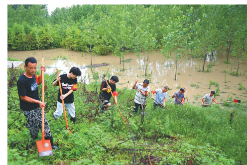
7月14日，安徽阜南县王家坝镇王家坝村农民在巡堤查险。

据新华社北京7月15日电（记者周圆）全国即将进入“七下八上”防汛关键期。记者15日从应急管理部获悉，经多方会商研究，未来几天，我国防汛战线将由南向北延伸，防汛形势依然严峻。国家防总当日针对河南省启动防汛四级应急响应。