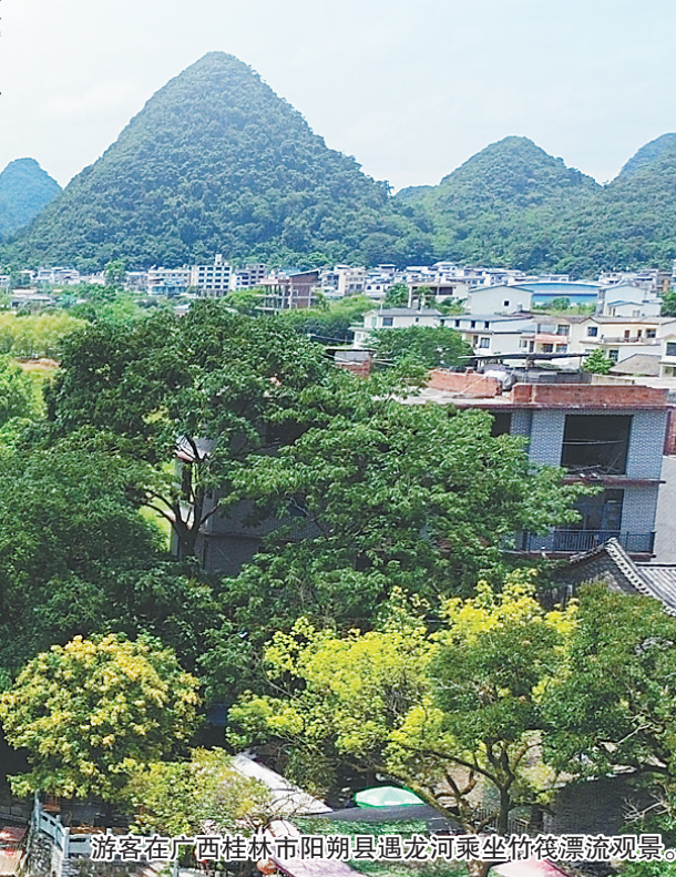
游客在广西桂林市阳朔县遇龙河乘坐竹筏漂流观景。