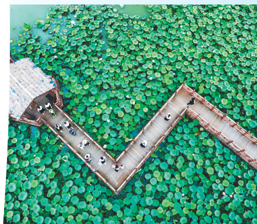
游人在江苏兴化里下河国家湿地公园游玩。