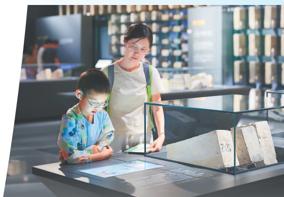
家长陪伴孩子在南京城墙博物馆参观。