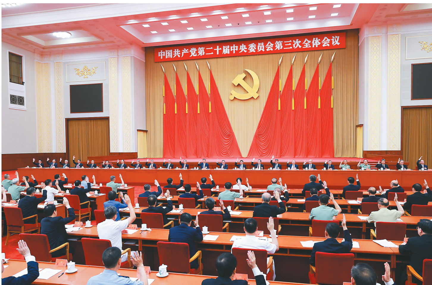
中国共产党第二十届中央委员会第三次全体会议,于2024年7月15日至18日在北京举行。中央政治局主持会议。