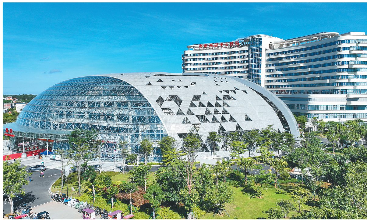
海南西部中心医院滨海院区外景。

据悉,海南西部中心医院滨海院区自2020年开工建设,共投入15.45亿元。项目一期占地面积153亩,建筑面积约15万平方米,编制床位500张,今年1月30日启动试运营。经过前期精心筹备和近6个月的试运营,滨海院区正式投入运营,将在门诊业务基础上开放急诊及病房业务,不仅为周边群众提供基础性医疗服务,确保多发病、常见病能得到及时诊治,还能环新英湾地区企业、及海岛岛旅游客人群提供更具专科特色的诊疗