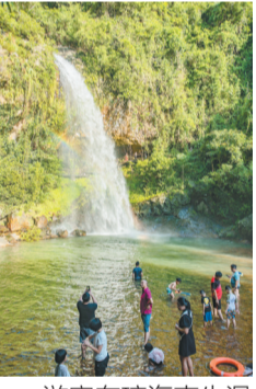
游客在琼海南牛瀑布玩耍。

暑热难耐,“哪儿凉快哪儿待着去”成为国人共识。来海南避暑,这个看似有悖很多人思维定势的话题,最近在各大社交媒体平台上有点火。通过多方采访,海南日报全媒体记者了解到,目前海南中部山区、河流峡谷、溶洞等地气温舒适,迎来暑期旅游小高峰。