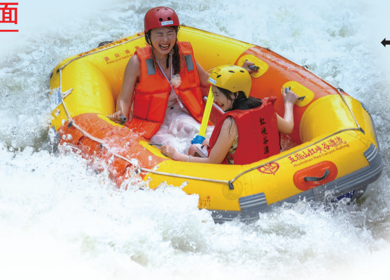
游客在五指山红峡谷文化旅游区体验漂流。