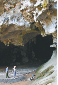
昌江皇帝洞。