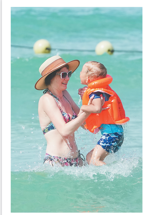
近日,在三亚大东海,外籍游客在海里嬉戏。