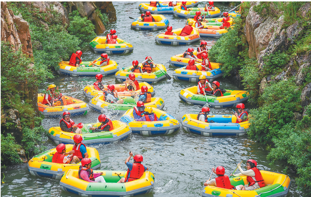
峡谷漂流 清凉一夏

进入暑期,全程3.8公里的五指山红峡谷文化旅游区漂流项目人气攀升。图为7月26日,游客在五指山红峡谷文化旅游区体验漂流。