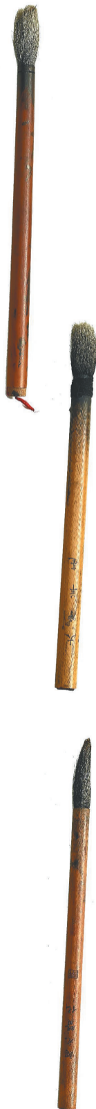
蒋兆和先生生前使用的毛笔。

此次，蒋兆和家属向中国国家画院捐赠的《与阿Q像》，是以鲁迅先生笔下的人物阿Q为创作对象，是蒋兆和的代表作之一，也是中国水墨人物画的经典之作。鲁迅先生曾说，“看人生是因作者而不同，看作品又因读者而不同。”有文学大家曾这样理解蒋兆和笔下的阿Q：“你看，作者所系怀的阿Q，是那根使阿Q受尽凌侮的辫子，而忽略了阿Q所忌讳的癞头；作者所瞩目的是‘精神胜利法’惨败后那股在外在世界与自己拳头之间停留的目光。就连那个仅有的拳头，也只能依靠自己的另一只手托住。越过了一派调笑，作者从鲁迅先生这篇伟大的小说里读出了眼泪——作者创作过程的心情是阴暗而庄严的，他的这幅画面也染着同样的色调。”