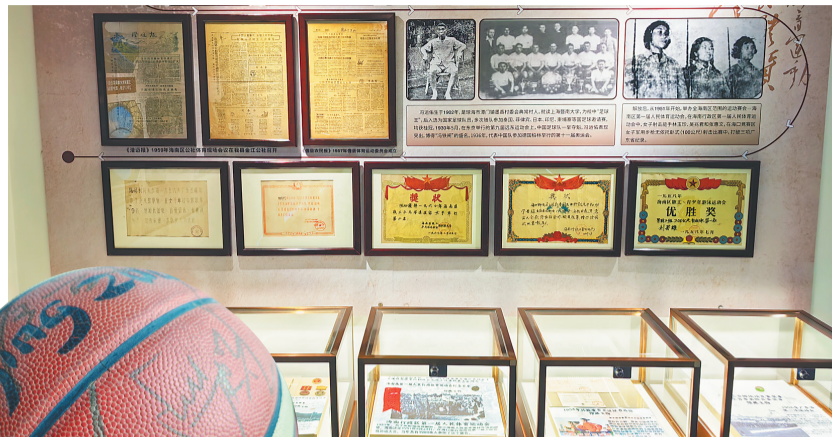
天福体育博物馆的藏品展示。

除此之外，天福体育博物馆还收藏有一枚铜质徽章，这枚徽章不仅精致，更承载了海南体育的初章。1950年，海南就举办了第一届全民运动会。这枚徽章上的椰子树图案，不仅展现了海南的地域特色，更见证了体育精神的萌芽。而另一枚第3届海南行政区人民体育运动会的裁判员胸花，虽小却意义非凡，它记录着海南体育发展历史中的点点滴滴，是体育精神传承与发扬的见证。