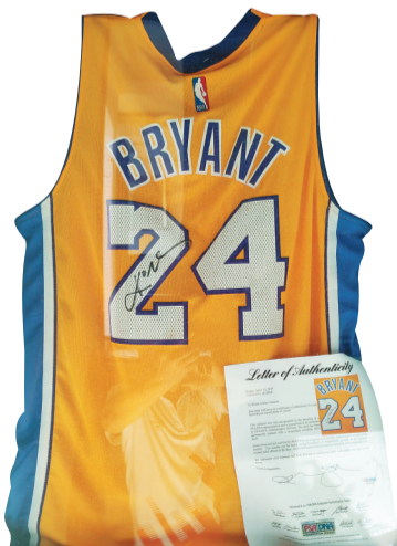
球星科比亲笔签名的球衣。

展览馆还珍藏着一件特别的藏品——迈克尔·乔丹在获得第六个NBA总冠军时的签名球衣，这不仅是乔丹辉煌职业生涯的见证，更是篮球历史上的珍贵财富。此外，美国篮球杂志、早期的皮革篮球、老鹰队球星纪念版玩偶以及艾弗森的签名球鞋，这些藏品不仅展现了篮球文化的多样性和丰富性，更记录了篮球发展史上的点点滴滴。