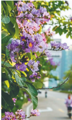
海口街头的大花紫薇。