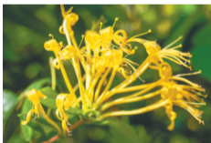
海南热带雨林里的大花忍冬花朵。