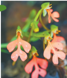
五指山一带的橙黄玉凤花。