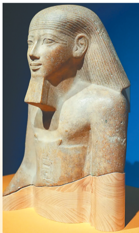
饰有假胡须的国王雕像。