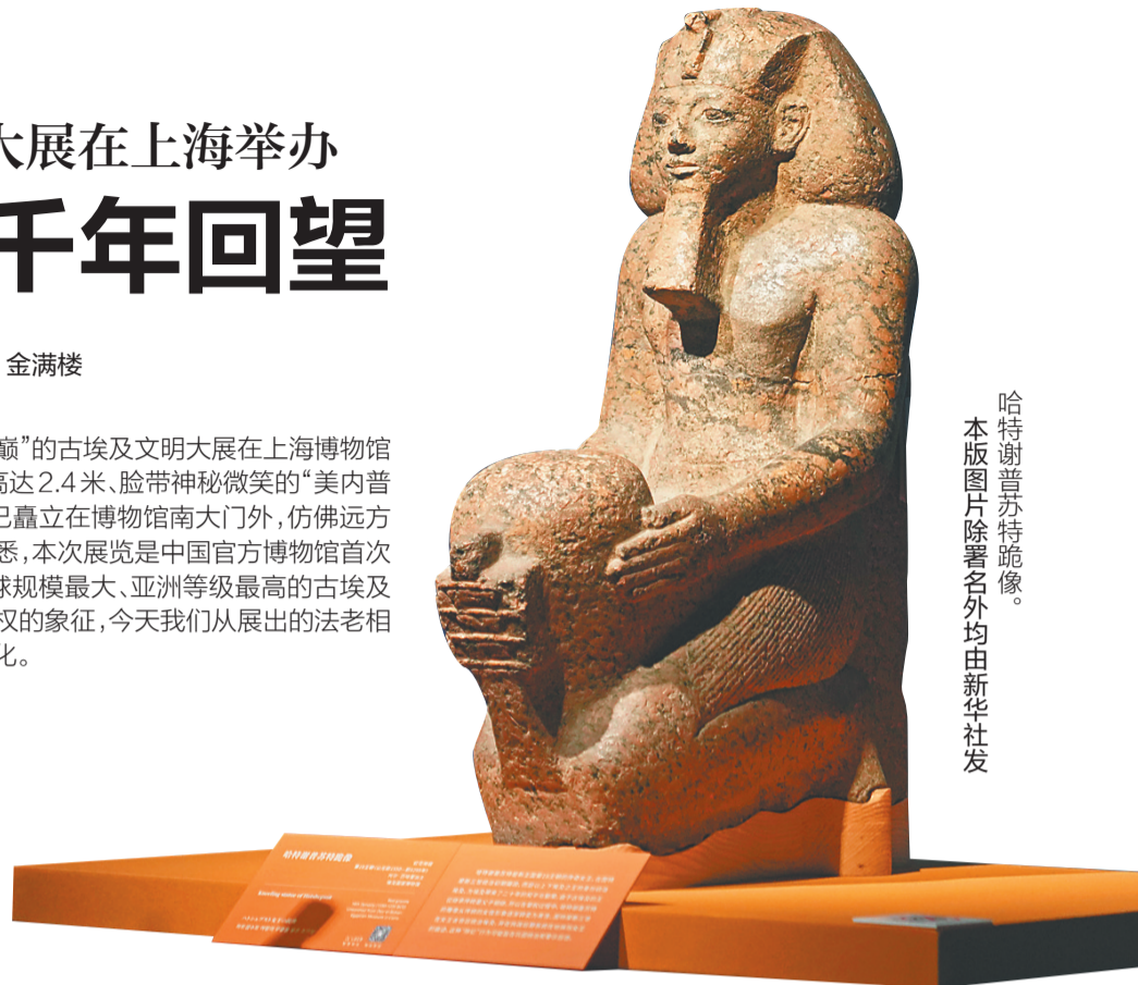
哈特谢普苏特雕像。