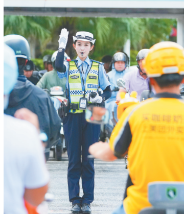
在三亚市凤凰路和迎宾路交叉口，交警引导行人车辆有序通行。