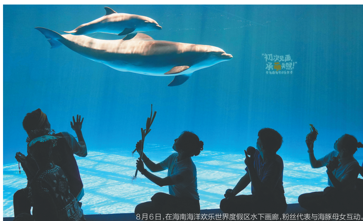
8月6日，在海南海洋欢乐世界度假区水下画廊，粉丝代表与海豚母女互动。

“娜雅”是一只西班牙宽吻海豚，此前在欧洲生活的11年间从未自然受孕和生育。两年前，海南海洋欢乐世界通过欧洲濒危物种计划的国际海豚交流项目，引入包括“娜雅”在内的九只宽吻海豚。一个月前，“娜雅”顺利分娩诞下了“小公主”，该度假区通过社会征名为“灵宝儿”，这是海南首只在人工环境中自然受孕生产的宽吻海豚，也是海南