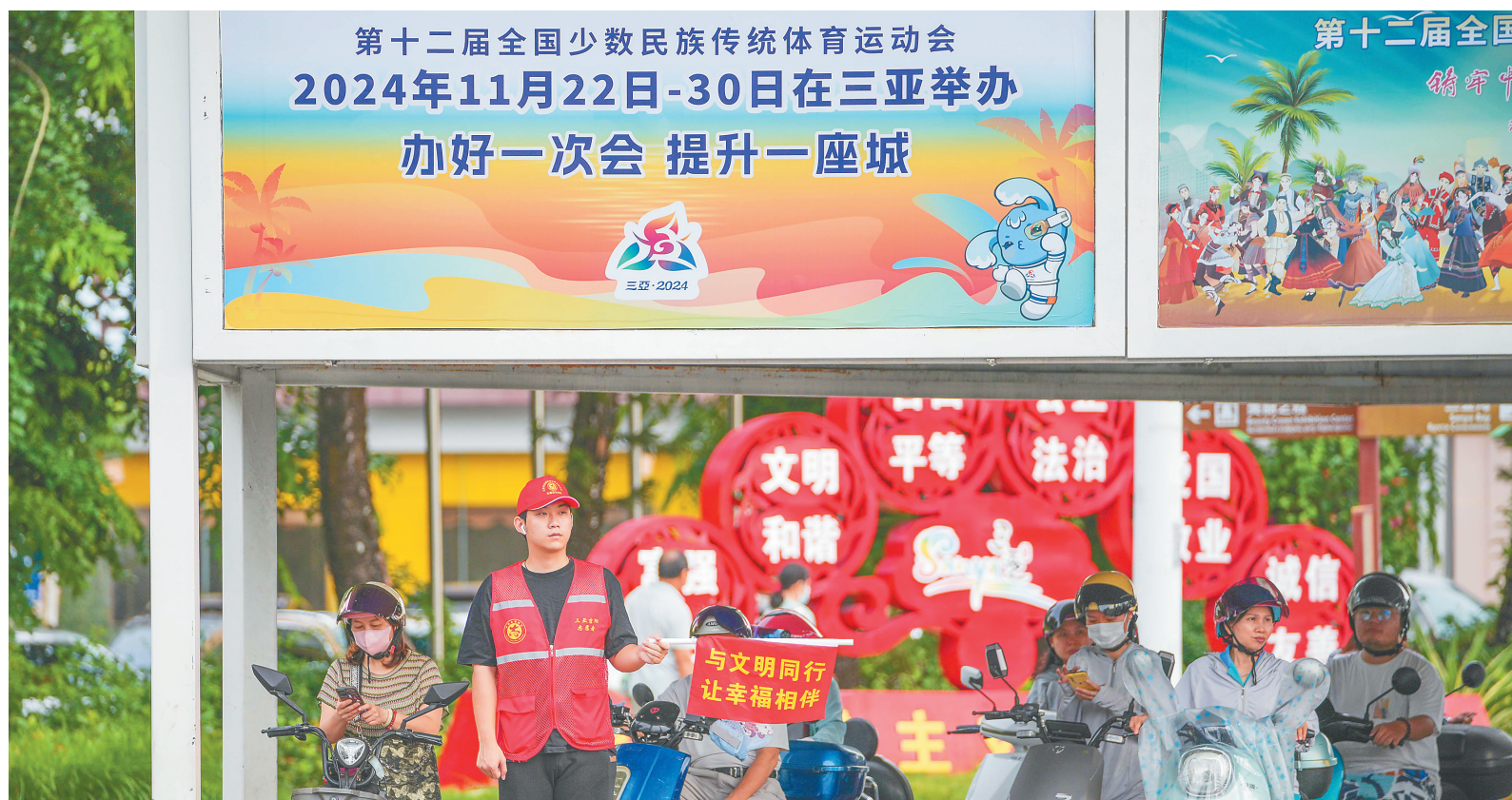
在三亚河东路和新风街交叉口，志愿者手拿标语，提醒过往车辆行人文明出行。