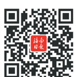
调味料如何制成。扫码看海南特

从业人员表示，以海南本地的热带风物制成的饮品，不仅能传播健康、原生态的消费理念，也希望能为海南特色文旅的一部分，进行新茶饮领域的“海南”输出。