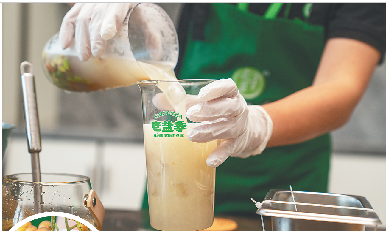
老盐季的店员在制作老盐黄皮果饮。