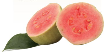
均为资料图 本组图片除署名外 红心芭乐。