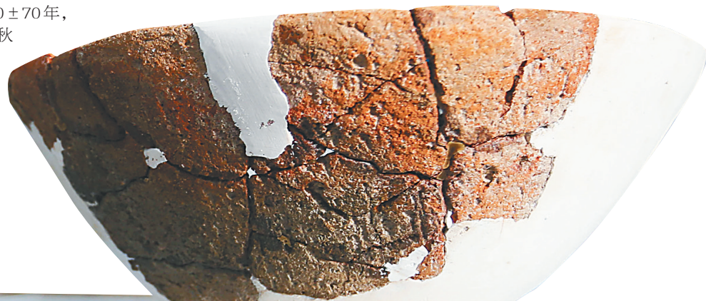
三亚英墩新石器遗址出土文物。