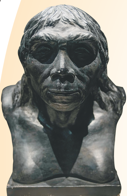
▲ 周口店遗址文化展展出的“北京人”复原像。 海南日报全媒体记者 张茂 摄

► 落笔洞遗址发掘现场。资料图 ▼ 周口店遗址文化展展出的棕熊脚骨模型。 海南日报全媒体记者 张茂 摄