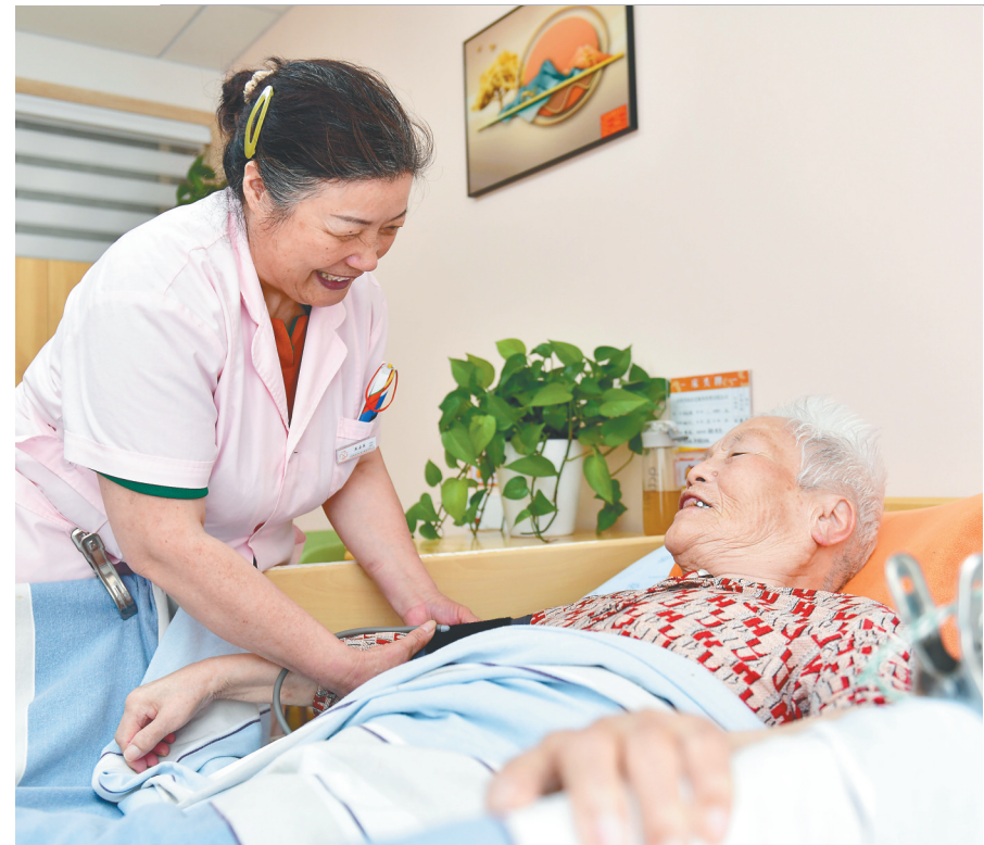
在山东省日照市东港区石臼街道津海社区养老服务中心，工作人员照料失能老人。