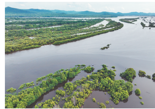
图为8月10日拍摄的乌苏里江饶河段。

新华社北京8月12日电(记者刘诗平)记者12日从水利部了解到，未来一周，受强降雨影响，海河、黄河、长江、珠江、辽河流域的一些河流可能发生洪水过程，防汛形势依然严峻复杂，水利部门正进一步加强防汛关键期洪水防御。