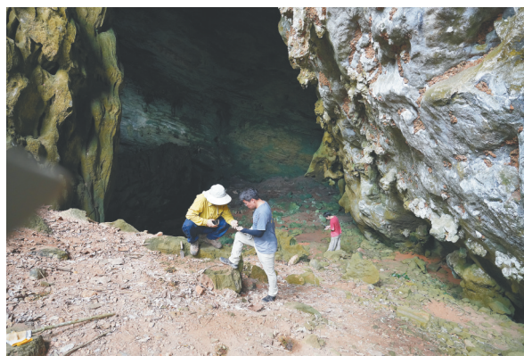
考古工作者正在研究洞穴采集标本。