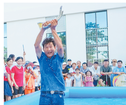
去年三亚开渔节上，渔民参加捕鱼比赛。

崖州中心渔港海洋文化科普馆也将于开渔节当天开馆，展出丰富的海洋生物标本和模型，还设置互动体验区，公众可体验钓鱼机等设备。当天还将举办摸鱼大赛，两人一组徒手摸鱼，每轮10分钟，所有轮次结束后根据摸鱼数量评出前三名。市民游客还可参与渔书传情活动，写下祝福投递进渔港信箱，传递给亲朋好友。