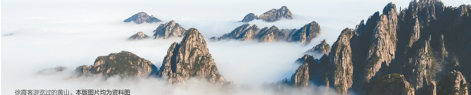
徐霞客游览过的黄山。本版图片均为资料图

屈大均早年游历广东各地，考察自然风物、风土人情，晚年时写成内容广博的《广东新语》。这本书中，有大量对海南自然景观的描写，比如“自儋州至崖千里间，木多杂树，又多树上生树，盖鸟食树子，粪于树枝而生者。巨且合抱，或枝柯伏地下，连理而生……”这几句话描绘的树木奇观，就具有鲜明的海南地域特征。固