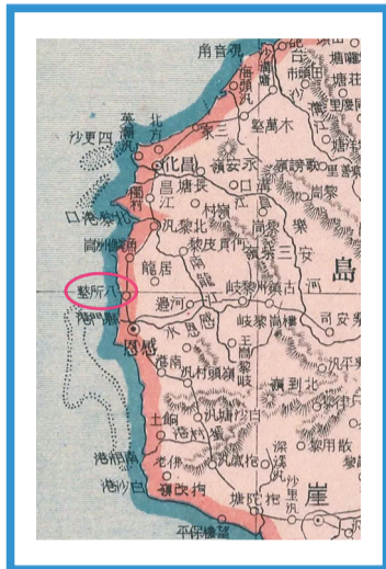
在清末地图中,今八所镇所在地被标注为“八所整”