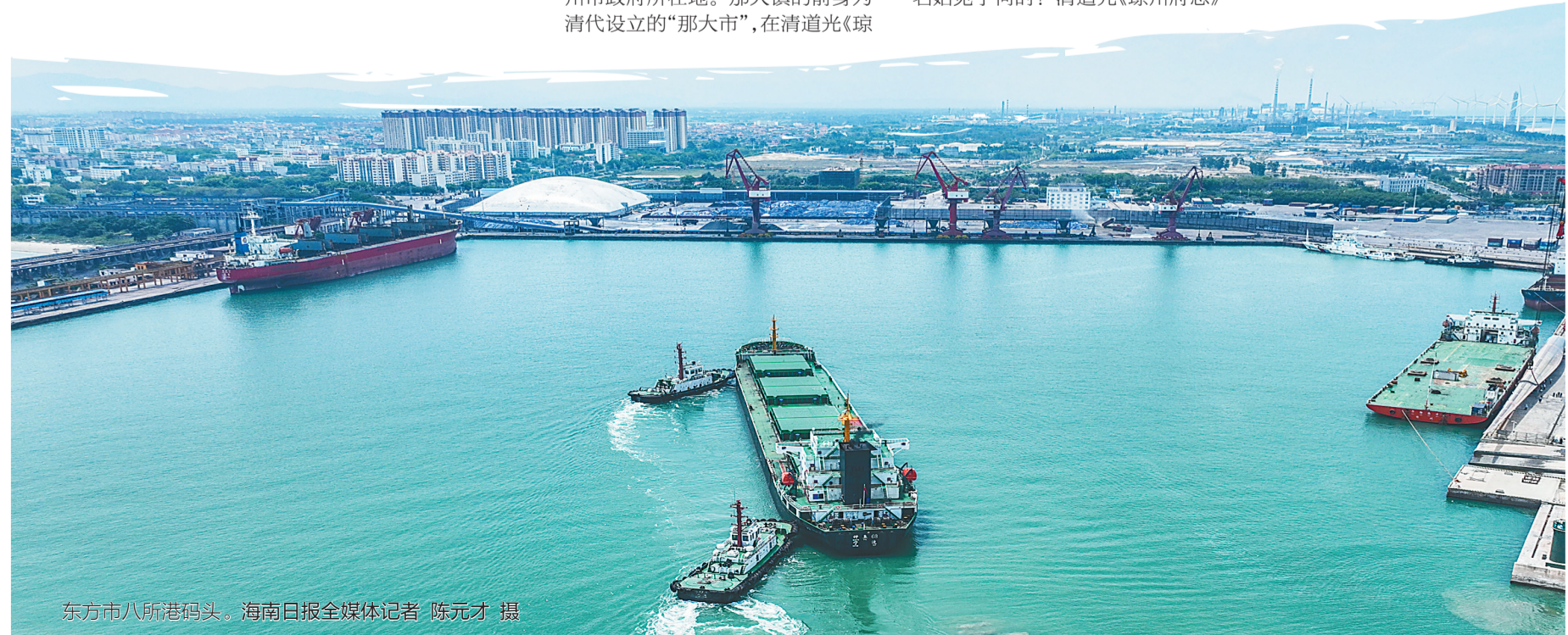
东方市八所港码头。