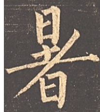
柳公权《玄秘塔碑》里的“暑”字。