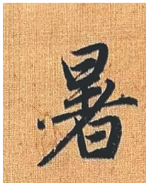
赵孟頫《千字文》里的“暑”字。