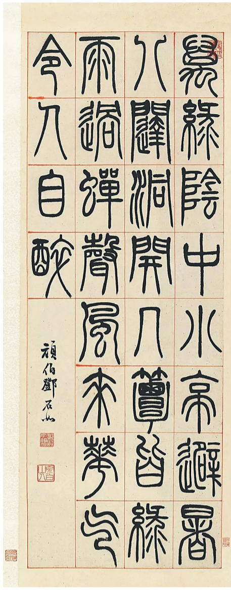
邓石如《朱韩山座右铭》。

在楷书中，“暑”的书写加强和优化了线条的处理，顿挫转折有度，往工整的方向进一步规范了字形。演变至行草书时，“暑”字有了更多个性化和艺术化的展示。行草书的基本原理是注重书写速度和流畅性，因此，“暑”字的笔画转折处多采用圆转或方转，使字形看起来更流畅自然。书写者通过在行笔时简化笔画，以及笔画的合并、简省、牵连等，使行草书的“暑”字结体更加行云流水。