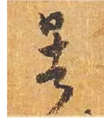
怀素《千字文》里的“暑”字。