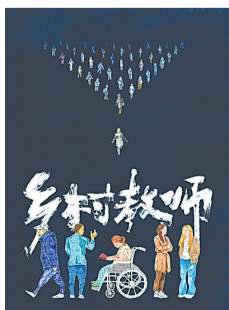
《乡村教师》海报。本版图片均为资料图

网络纪录片《乡村教师》聚焦贵州铜仁乡村中小学教育的生动细节,讲述了一组温暖又令人感动的乡村教育故事。老师们为残疾儿童送教上门,陪伴留守儿童,通过书法和啦啦操等文娱活动给孩子们的生活增添光亮。整部影片没有画外音,字幕旁白也较少,与之相对的是丰富明快的镜头语言,娓娓诉说着孩子们的成长,以及乡村教师的无私奉献与不懈坚守。