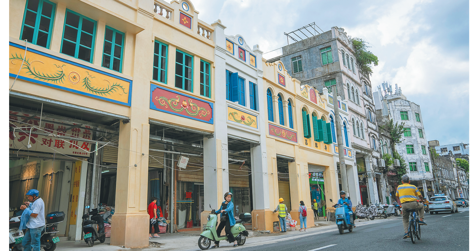
匠心传承 修缮古建

本报海口8月22日讯(海南日报全媒体记者刘梦晓 通讯员曹柳)8月22日,位于海口江东新区的海口市灵山中学经过改扩建后焕然一新,即将迎来开学。