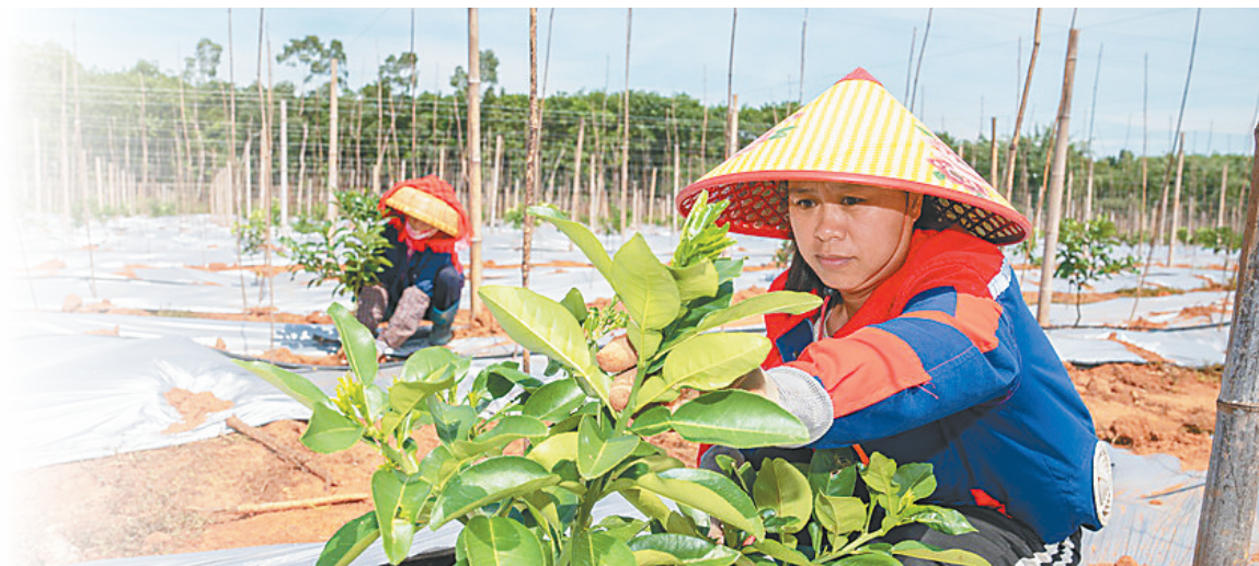
近日，在位于临高县多文镇的海南农垦红华农场公司，职工在泰国青柚产业园里栽种柚子苗。

近两年，海南省农垦投资控股集团有限公司(以下简称海垦集团)始终坚持农垦姓“农”，围绕《关于持续深化海南农垦改革推进农垦高质量发展的若干意见》，聚焦热带特色高效农业发展，持续推进“一场一品”战略，加速培育新质生产力，优化全产业链，打造现代农业大基地、大企业、大产业，力争成为农业行业标杆企业。