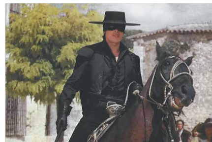
阿兰·德隆在电影《佐罗》中的经典形象。