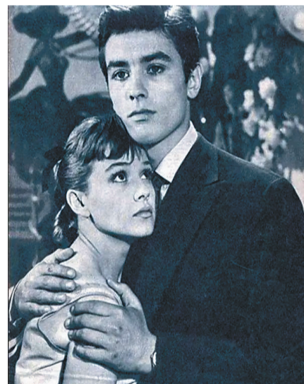
电影《当女人插手》剧照。

阿兰·德隆凭借其魅力四射的表演，不仅将佐罗这个充满正义感的侠客形象深深烙在了中国观众心中，还促进了中法两国之间的文化交流和相互理解。尽管他已经离世，但他留给我们的一系列经典银幕形象，将作为宝贵的文化遗产，继续在中国乃至全世界流传下去。