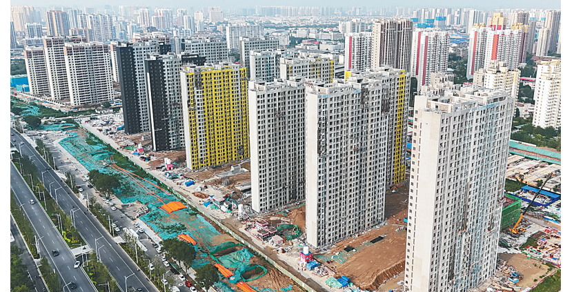
俯瞰河北省保定市城中村改造三期工程南刘各庄村安置区项目。

近日,关于房屋养老金的话题冲上热搜,引起社会关注。记者26日就此采访了住房城乡建设部相关司局负责人,解答百姓关心问题。