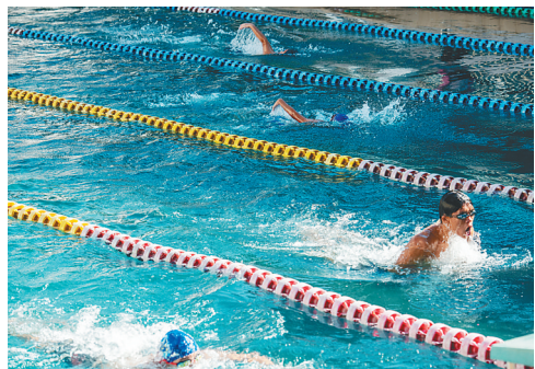
日前,琼海市中小学生在该市体育中心游泳池学习游泳。每逢暑假,游泳都会成为许多学生的假期必修课。