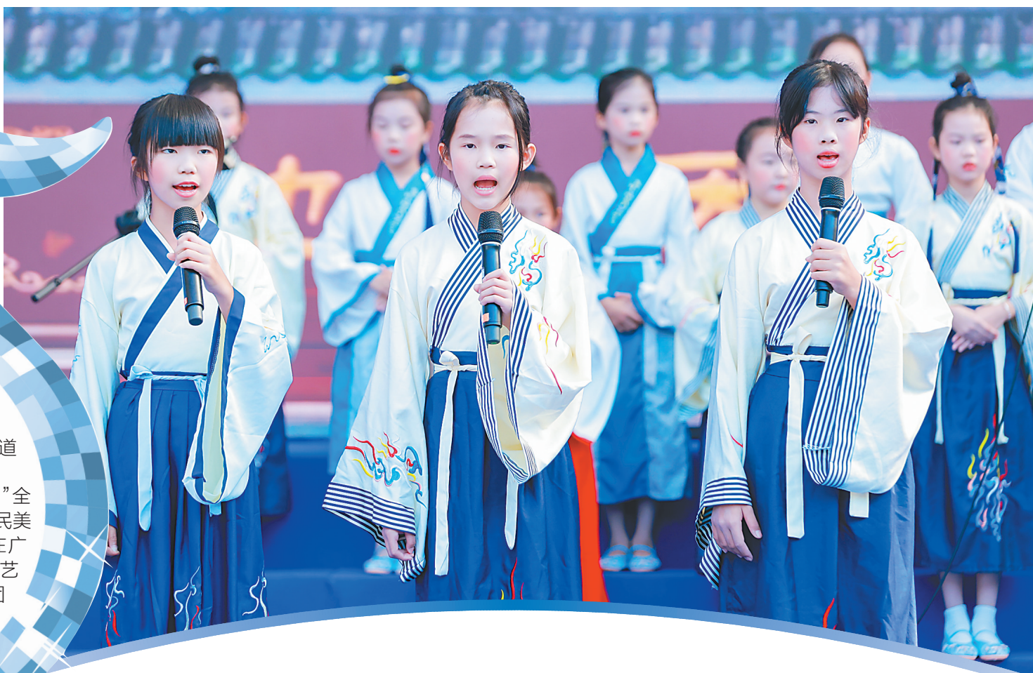
三亚市群众艺术馆崖州军话民谣女子少年合唱团参加演出。