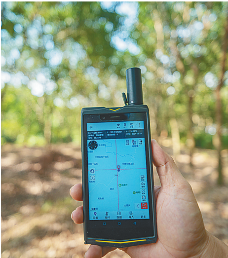
工作人员展示采集数据的手持设备。