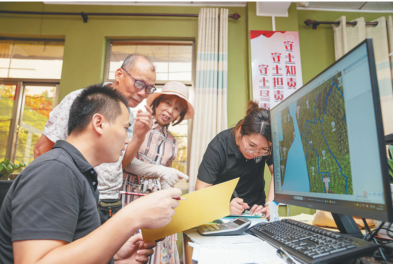
在海南农垦中坤农场公司，土地管理工作人员利用海南农垦土地资源“一张图”系统为群众服务。