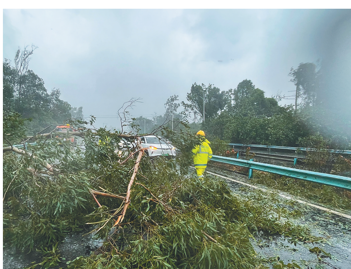
9月6日，海南环岛东线高速，道路旁树木倒伏，海南交投养护人员在清理路障。