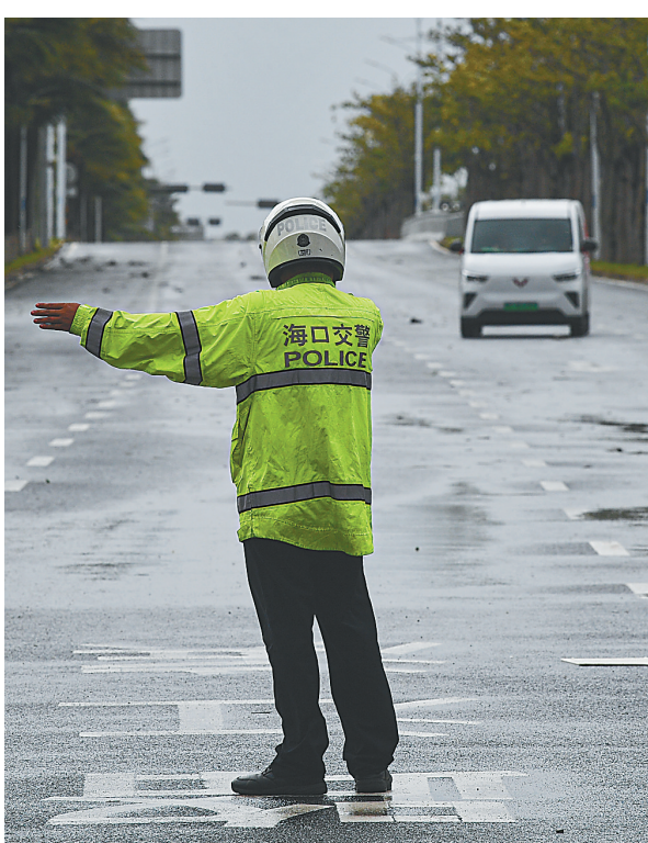
9月6日，交警在海口市文明东隧道外引导车辆绕行。