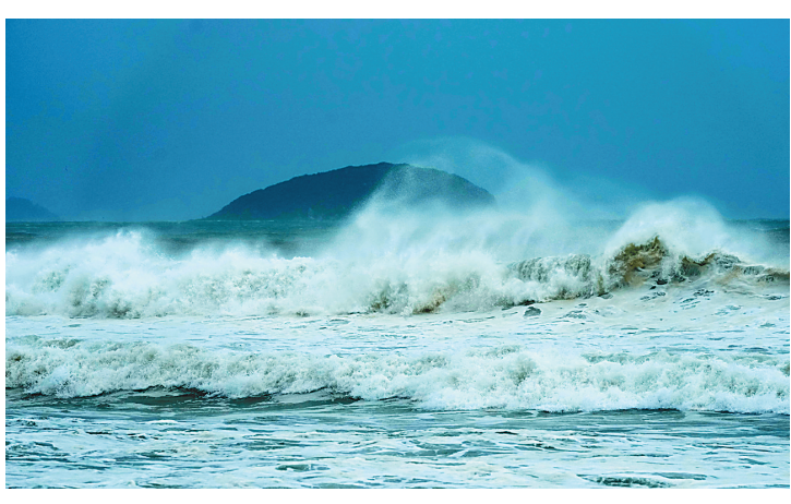
9月6日，受台风“摩羯”影响，万宁市东澳镇港门嘴海滩出现风暴潮。