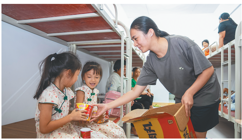
9月6日，在琼海市潭门中学，安置点工作人员发放泡面等物资。