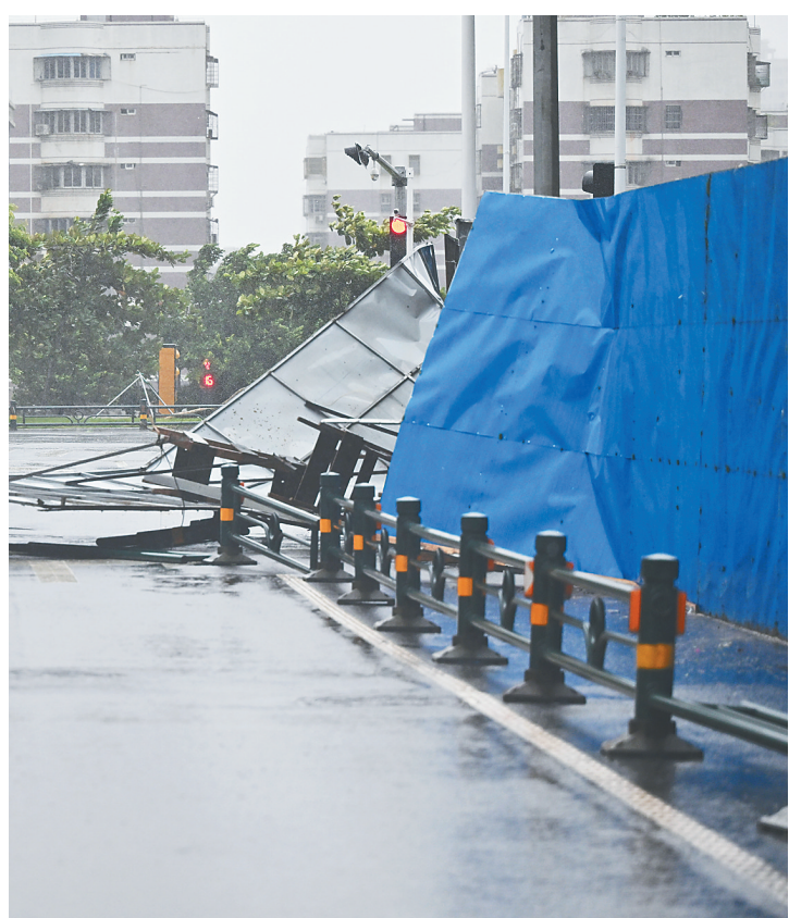
9月6日，海口市大英山东二街一处工地的挡板被风吹倒。