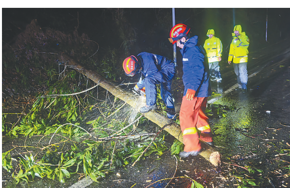
受台风“摩羯”影响，万宁地区多路段出现树木倒伏。9月6日晚，万宁消防连夜展开道路清障处置行动。