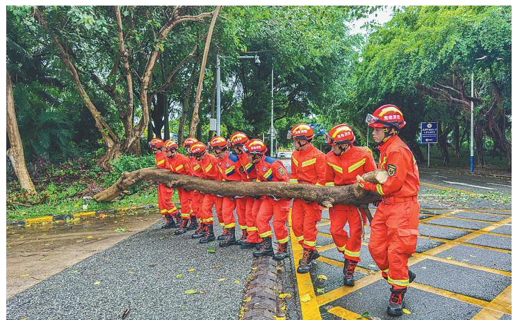
9月6日14时许，三亚消防多名救援人员将被风吹倒的树进行切割，并移至路边安全区域。