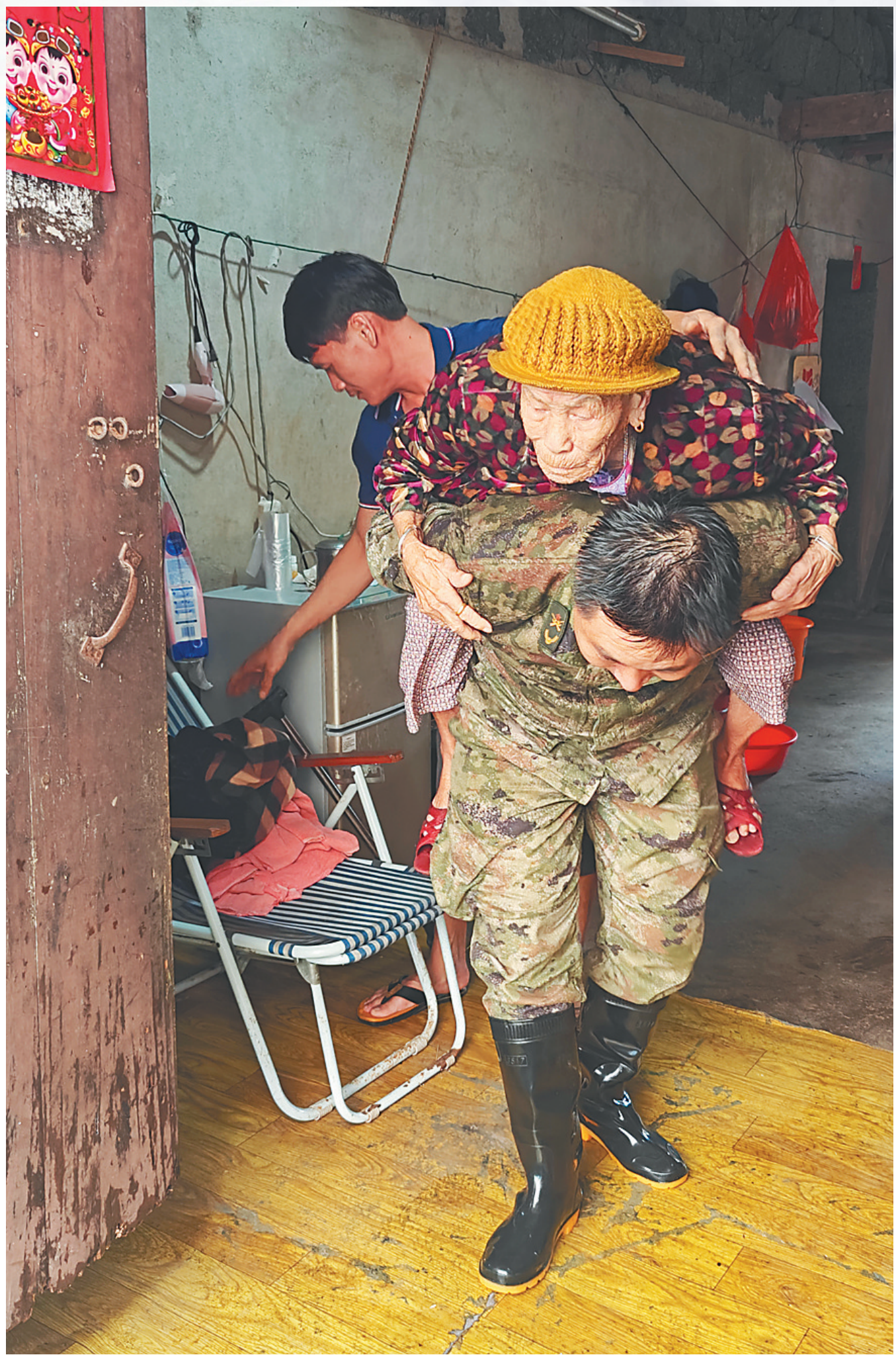
9月6日，海口市秀英区石山镇，专武干部背上行动不便的老人进行转移。

这是一场与风竞速、同雨赛跑的较量，这是一场与超强台风的搏斗！ 9月6日16时20分前后，台风“摩羯”以超强台风级在海南文昌沿海登陆，登陆时中心附近最大风力17级以上。 狂风怒号，暴雨如注。这是一头罕见的“猛兽”，其来势迅猛、威力巨大，给我省带来严重的风雨影响，导致电力中断、交通受阻、房屋受损…… 海南！海南！面临严峻考验！ 危急关头，全省干部群众众志成城、顶风战雨，打响了一场艰苦的防风防汛大仗、硬仗。 组织群众紧急转移、及时清理路面障碍、切实做好各项保障……风雨中，总有人挺身而出、冲锋在前。 9月6日，在疾风骤雨中，我们用镜头记录下超强台风中一个个难忘瞬间。