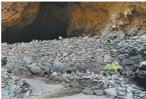
皇帝洞洞口的石墙。

霸王岭之名古已有之，只是尚未写作“霸王岭”，其名称的由来和演变，海南本地史籍也有记载。它作为黎母山山脉的一部分，在明代以前，史志将其统称为黎母山或者黎婺岭。明代正德《琼台志》昌化县境图东南部的“黎婺岭”，