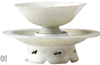
宋代青白釉葵口托杯。