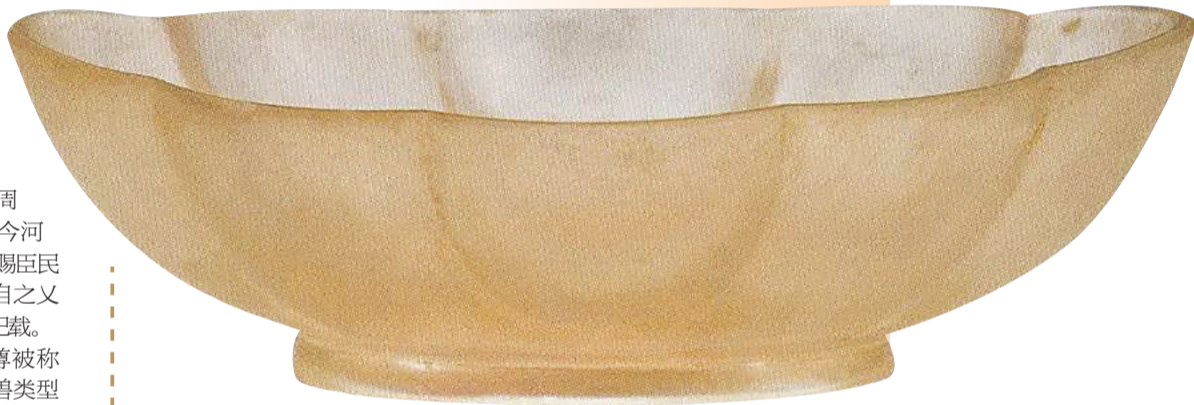
唐代素面水晶八曲长杯。