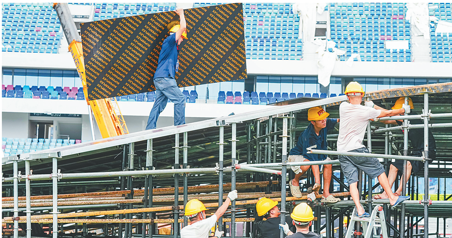
海口五源河体育场全力抢修