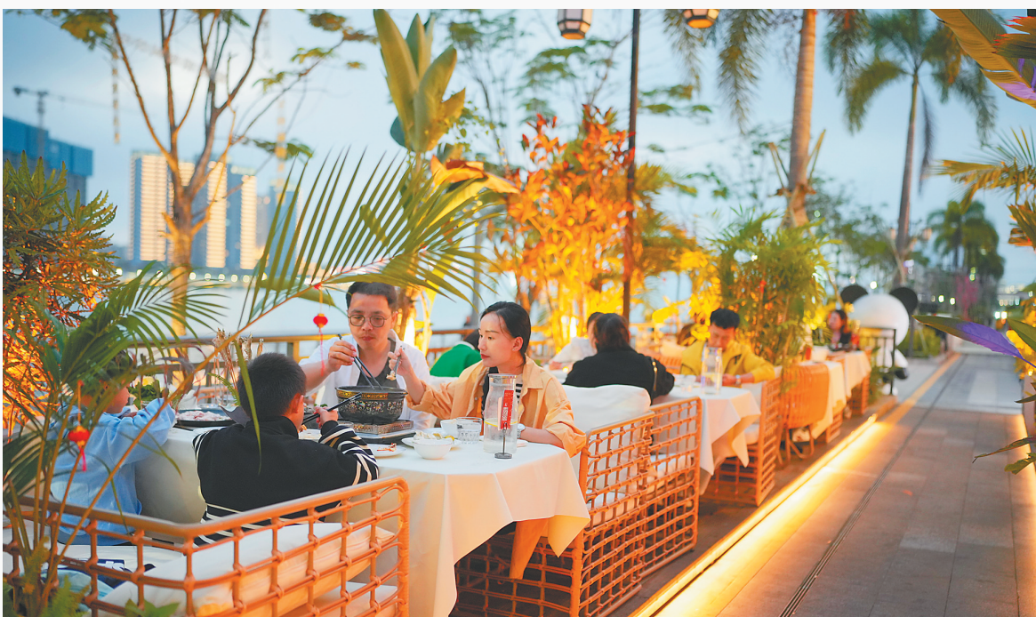
食客在海口湾品尝佳肴，体验城市慢生活。