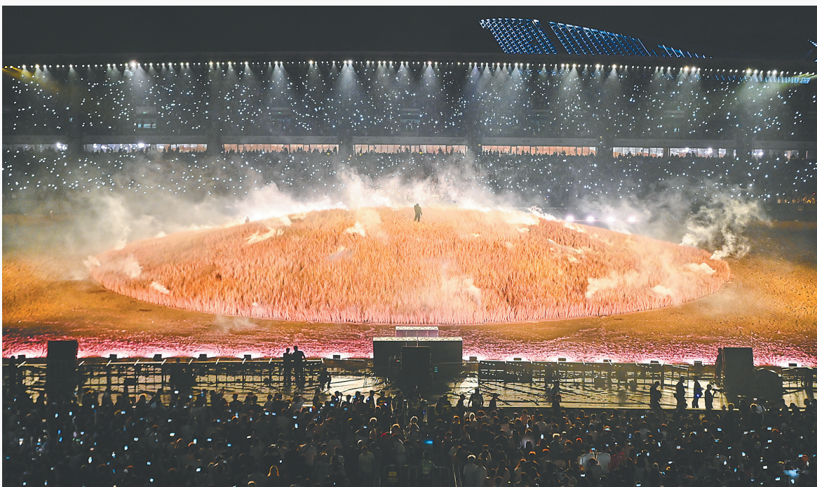
坎耶·维斯特世界巡回试听会海口站开演，吸引大批观众到场观演。