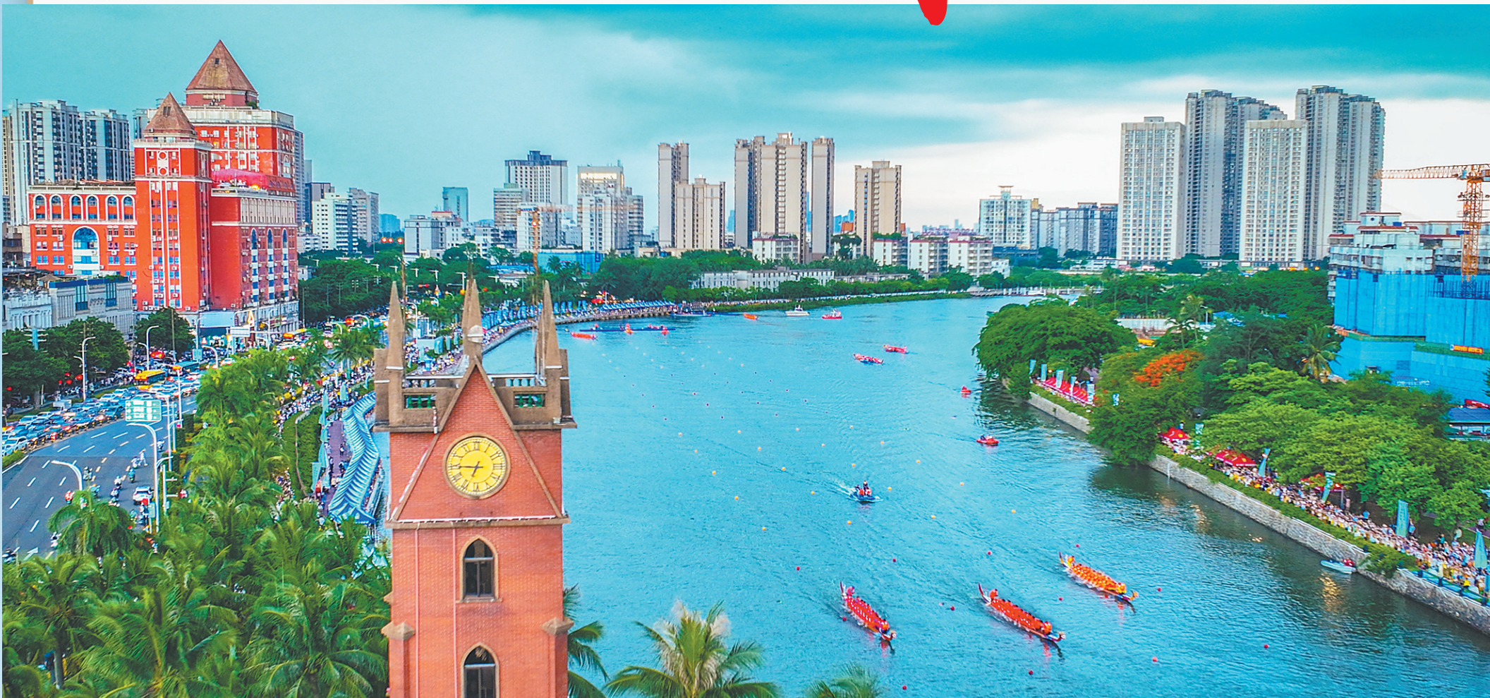
海口市海甸河钟楼一带景色迷人。