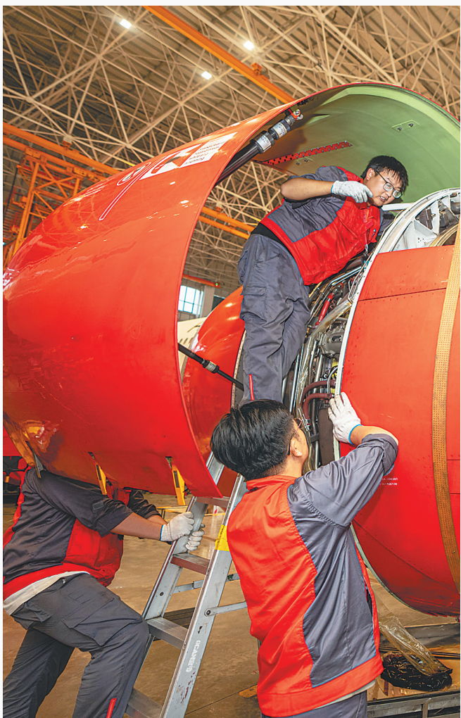
海南自贸港一站式飞机维修产业基地内，工人在检修飞机。