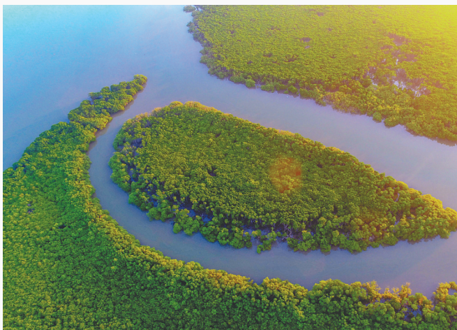
海口东寨港红树林湿地风光旖旎。