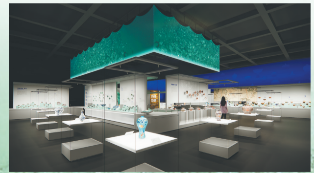
南海西北陆坡一号二号沉船考古成果特展展厅效果图。

我们也不能忘记,每一艘沉船背后都是一场海难,许多船员的生命永远定格在了500多年前的那一刻。在欣赏文物珍品的同时,我们亦应铭记那些在汪洋大海上苦苦求索的先民。