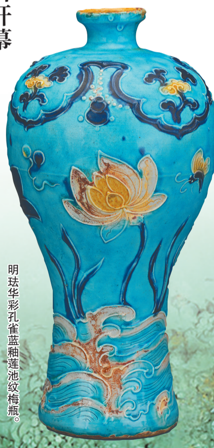
明珠华彩孔雀蓝釉莲池纹梅瓶。

2022年,中国科学院深海科学与工程研究所进行航次工作时发现了它们。水下考古调查随即启动,逐步揭开了这两艘沉船的神秘面纱。9月27日下午,“深蓝宝藏——南海西北陆坡一号二号沉船考古成果特展”将在中国(海南)南海博物馆开幕。