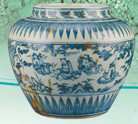
青花人物故事纹大罐。

除了一号、二号沉船的出水文物,此次展览还将展出从故宫博物院、山西博物院、吉林省文物考古研究所等处借展的文物共34件(套),包括乌木制品、瓷器等。此举旨在展示同一时期或同一类型的器物,供观众进行比较。