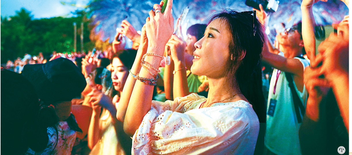
① 游客在体验打卡三亚海棠湾君悦酒店的空中餐厅。