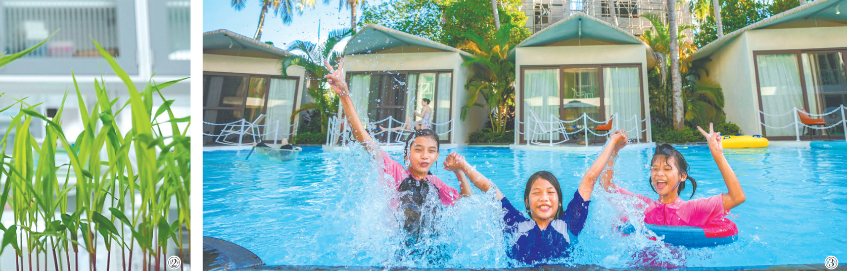
① 游客在体验打卡三亚海棠湾君悦酒店的空中餐厅。