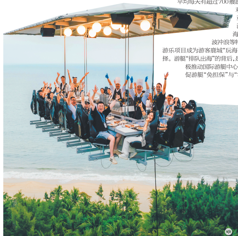
① 游客在体验打卡三亚海棠湾君悦酒店的空中餐厅。