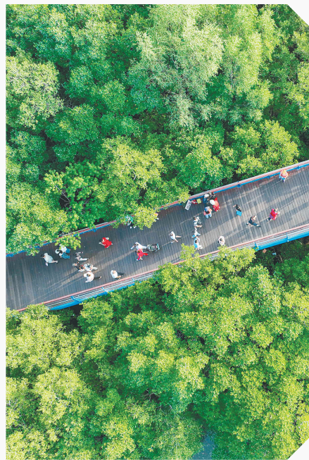
市民游客享受三亚美好环境带来的惬意生活。