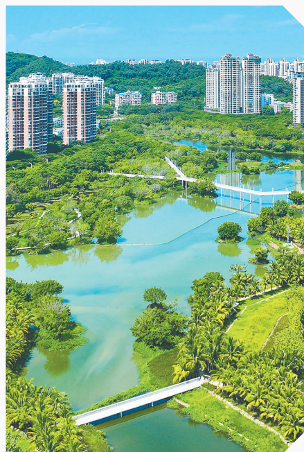
三亚东岸湿地公园。