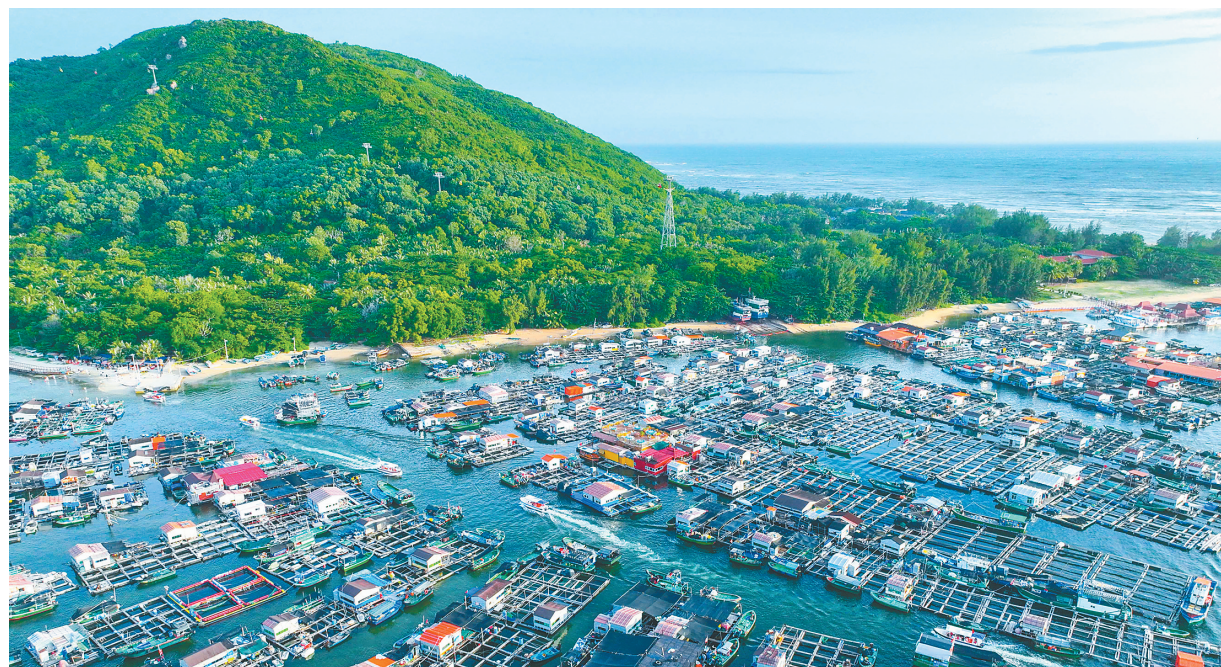
近日，陵水黎族自治县新村港的渔排间游艇穿梭，不少游客专程前来观光游玩。