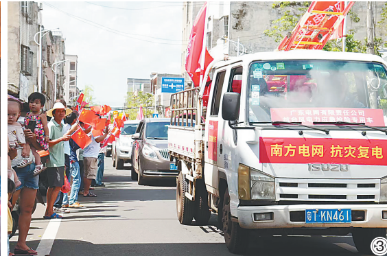
① 9月26日，临高千名群众欢送广东电网梅州供电局抢修队伍。