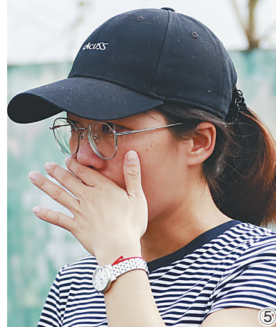
⑤ 9月24日，文昌文城镇群众在欢送贵州电网都匀供电局支援队伍后，不禁潸然泪下，依依不舍。