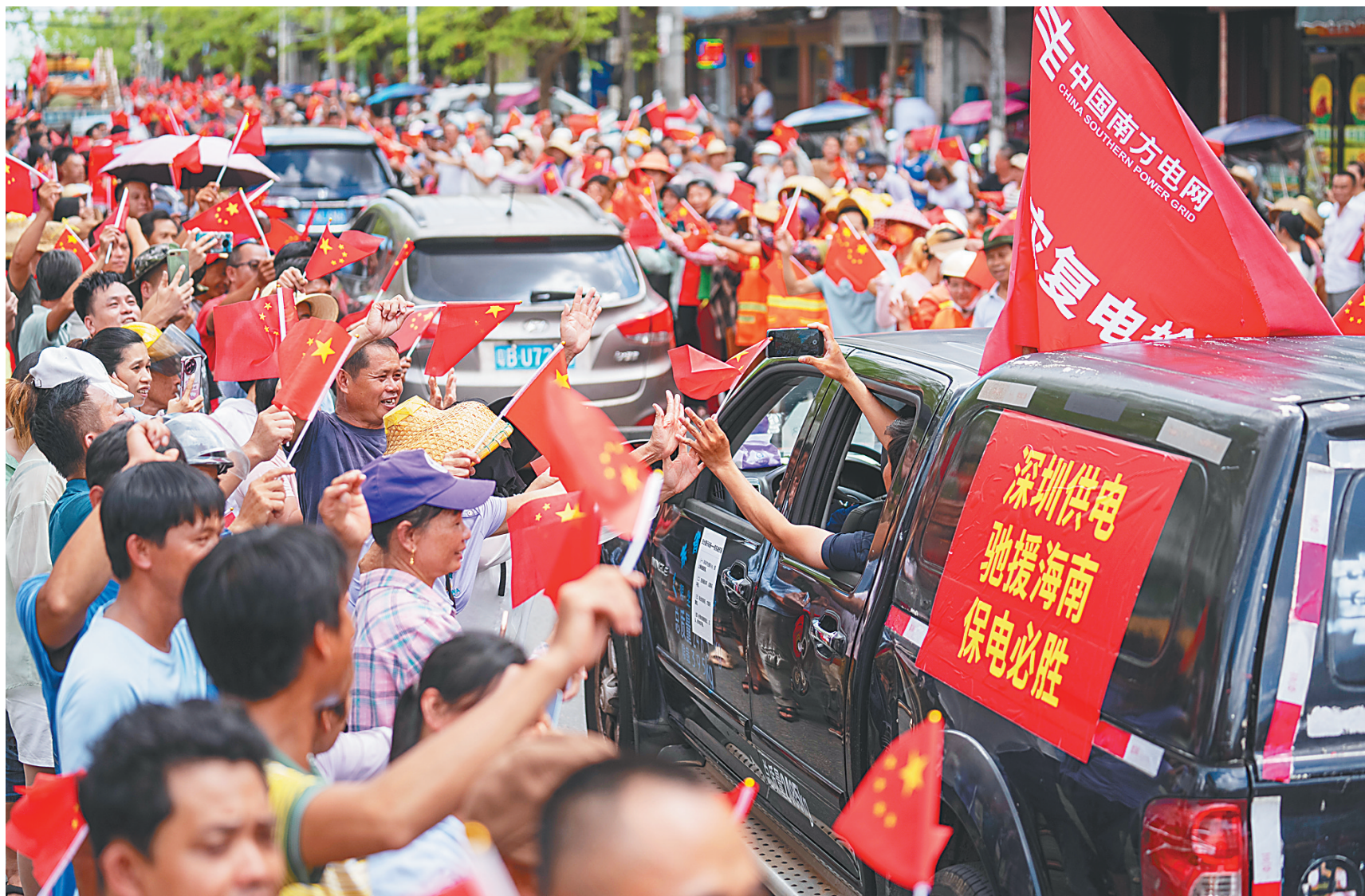
9月26日，文昌市翁田镇文政路，群众夹道欢送南方电网深圳供电局援琼抢修复电队伍返程。