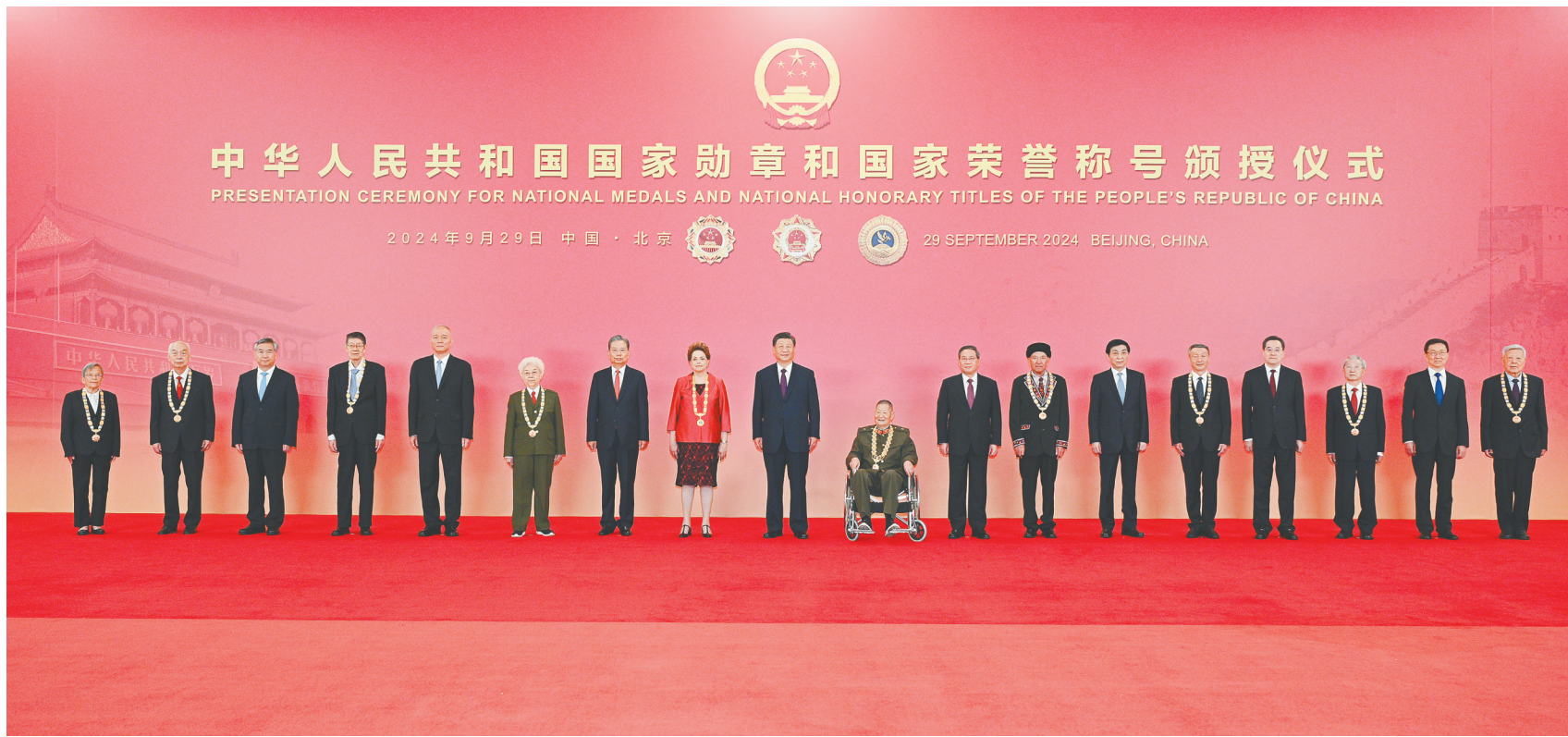
中华人民共和国国家勋章和国家荣誉称号颁授仪式 PRESENTATION CEREMONY FOR NATIONAL MEDALS AND NATIONAL HONORARY TITLES OF THE PEOPLE'S REPUBLIC OF CHINA

2024年9月29日 中国·北京 29 SEPTEMBER 2024 BEIJING, CHINA