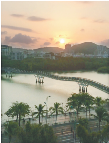
三亚河风光。资料图

五十年前,三亚河河面宽阔,对面的景物显得朦朦胧胧。两岸的滩涂很宽,繁衍着茂密的红树林。