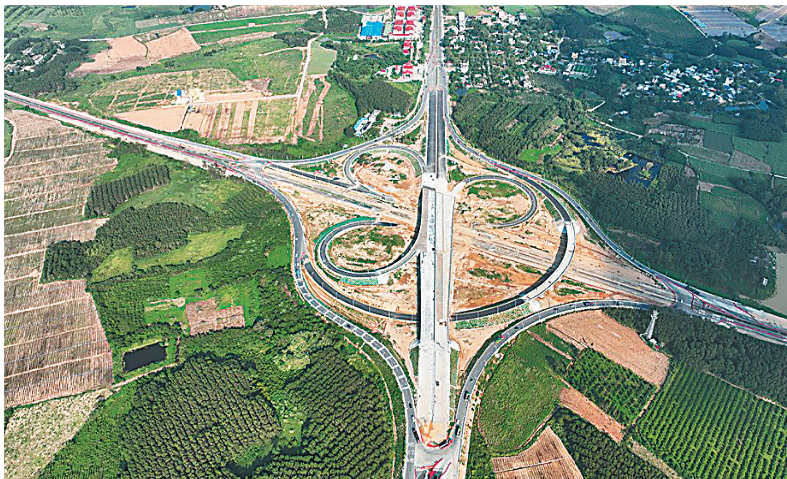
G98环岛高速公路大坡互通立交改建项目建设现场。

本报讯(海南日报全媒体记者张文君 通讯员黄海玲)近日,位于昌江黎族自治县的G98环岛高速公路大坡互通立交改建项目现场,110余名工人头顶烈日,进行桥面铺装、路面施工等,现场繁忙有序。国庆假期,该项目不停工,预计今年11月底建成通车。