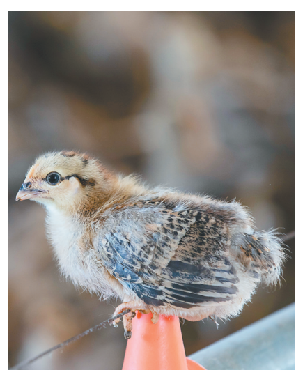
文昌市公坡镇水北村文昌鸡养殖场，台风“摩羯”过后孵出的鸡仔。