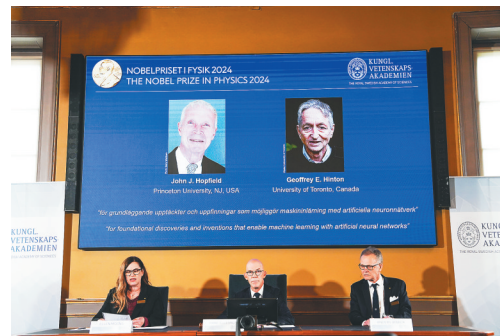
在2024年诺贝尔物理学奖公布现场, 屏幕显示奖项得主。

据新华社斯德哥尔摩10月8日电(记者郭奥)瑞典皇家科学院8日宣布,将2024年诺贝尔物理学奖授予美国科学家约翰·霍普菲尔德和英国裔加拿大科学家杰弗里·欣顿,表彰他们在使用人工神经网络的机器学习方面的基础性发现和发明。