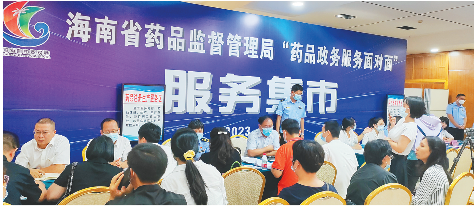
省药监局开展“药品政务服务面对面”服务集市活动，为企业答疑解惑。