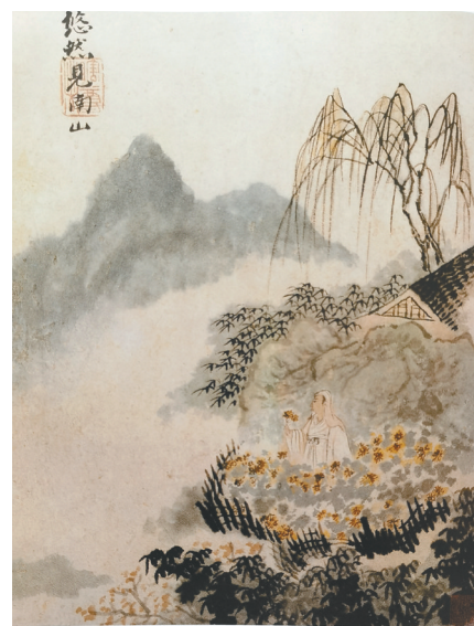
清代画家石涛系列《陶潜诗意图》之“悠然见南山”。

民间歌谣唱道：“菊花黄，菊花强，菊花香，菊花康。九月九日饮菊花酒，人共菊花醉重阳。”在此重阳佳节，从陶渊明与菊花的情缘中，可以体味传统文化情趣。