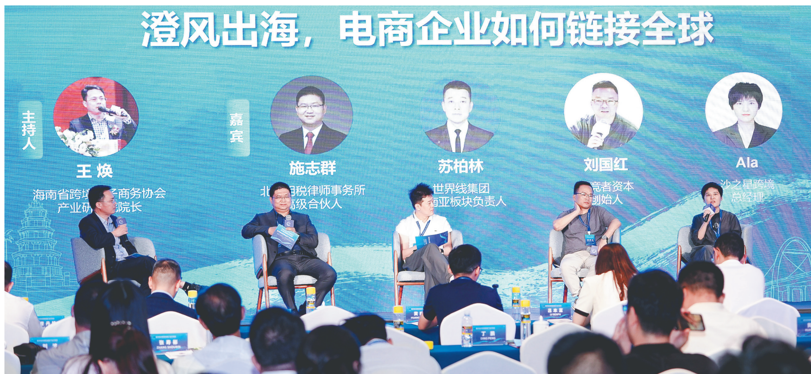
“澄风出海，电商企业如何链接全球”圆桌对话现场。

当前，澄迈正紧紧围绕“聚焦出海、投资澄迈”这一主线，重点打造两个“一号工程”，把优化企业出海服务的制度创新作为全面深化改革的“一号工程”，把面向企业出海需求的招商引资作为新质生产力发展的“一号工